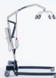
Birdie EVO XPLUS

▲ Maximale Ausstattung für höchste Ansprüche in der institutionellen Pflege