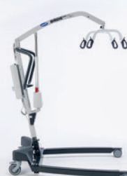
Birdie EVO PLUS

▲ Die Variante des Invacare Birdie EVO mit elektrischer Spreizung