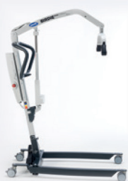
Birdie EVO COMPACT

▲ Die kompakte Variante ist schmaler und kürzer für beengte Räumlichkeiten