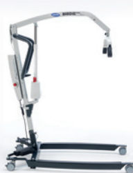
Birdie EVO Elektrisch

▲ Die Standard-Variante des Invacare Birdie EVO mit manueller Spreizung